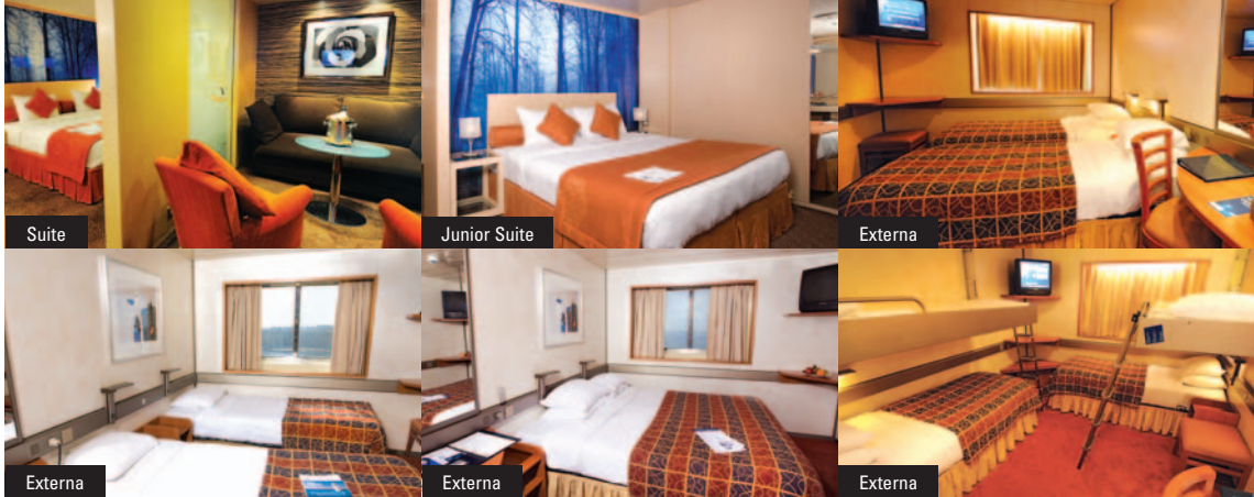
Imagens ilustrativas e apenas referenciais das cabines.

DESCONTOS E PROMOÇÕES: devem ser solicitados exclusivamente no ato da reserva e estão sujeitos a alterações sem prévio aviso e à disponibilidade de cabines. | PARCELAMENTO EM ATÉ 10 VEZES SEM JUROS no cartão de crédito. Ou de 1 a 10 vezes com juros com cheque pré-datado/boleto. Consulte condições específicas/coeficientes no site. Crédito sujeito à análise e aprovação pelo Banco FIBRA. Consulte convênios credenciados. | IBERO INCLUSIVE , PROGRAMA DE BEBIDAS INCLuíDAS, exceto TRAVESSIA, que oferece água mineral, cerveja, refrigerante e vinho da casa servidos durante o almoço e o jantar no buffet e restaurantes principais | Promoções até 30/11/2010: GRÁTIS 3º hóspede na mesma cabine , com base na Tarifa Tabela, não cumulativo a outras promoções. | FAMÍLIA 4x3 , excluindo aéreo e taxas: o 4º hóspede viaja GRÁTIS quando não mais disponíveis cabines quádruplas: sendo 2 adultos e 2 menores de 18 anos da mesma família em duas cabines duplas. Capacidade limitada de cabines. Taxas portuárias, de serviço e de assistência ao viajante não incluídas. | Consulte condições específicas: www.iberocruzeiros.com.br